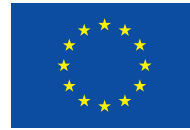
4c | vertikale Variante | positiv