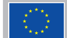
4c | vertikale Variante | negativ