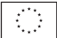
1c | Schwarz

Ausnahmen: Einfarbige Reproduktion (Spezifische Druckverfahren für Kleidung und Werbeartikel oder mit Pantone)